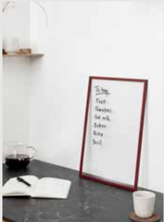
Frame | Page 4