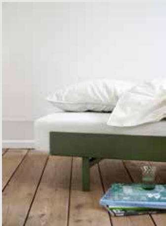
Bed | Page 13