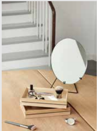
Standing Mirror | Page 8