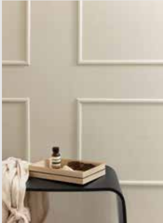
Organise | Page 10