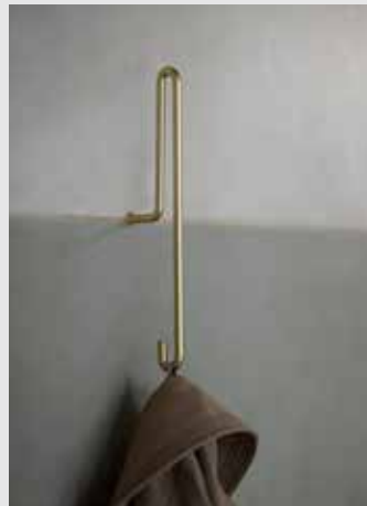
Wall Hook | Page 9