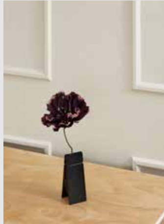
Pinch | Page 11