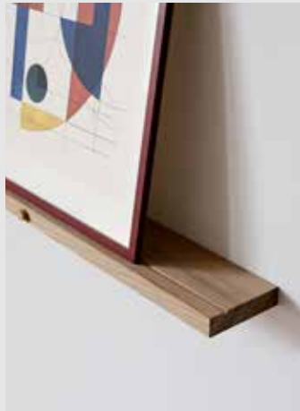
Gallery Shelf | Page 6