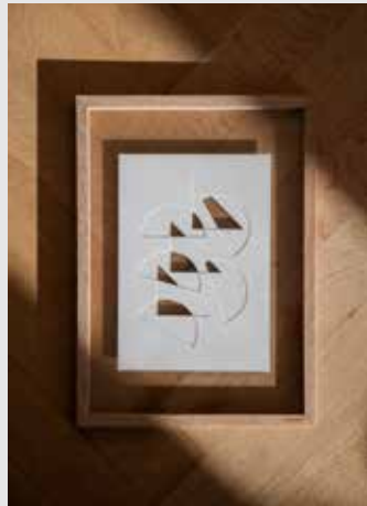
Papercut Artworks | Page 6