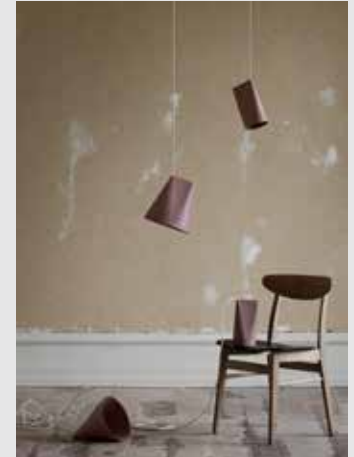
Ceramic Pendant | Page 11