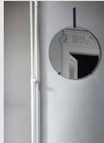
Wall Mirror | Page 7