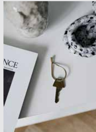
Key Ring | Page 9