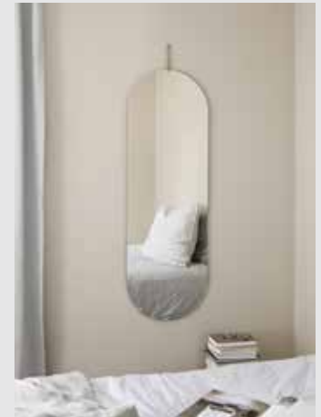
Tall Wall Mirror | Page 8