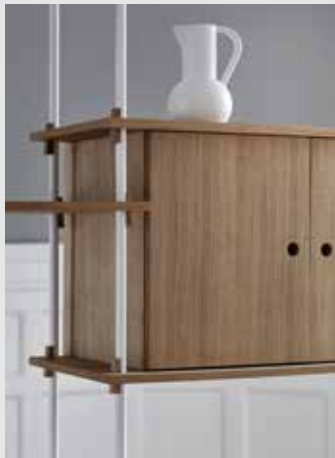
Shelving System | Page 15