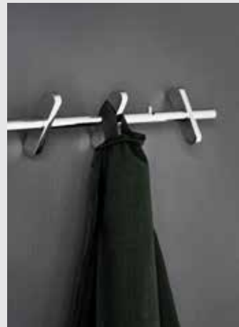
Coat Rack | Page 8