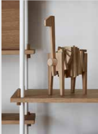
Polygrif | Page 10