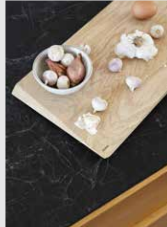
Cutting Board | Page 11