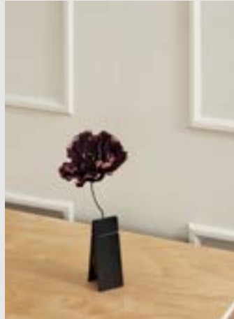
Pinch | Page 11