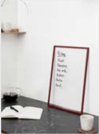
Frame | Page 4