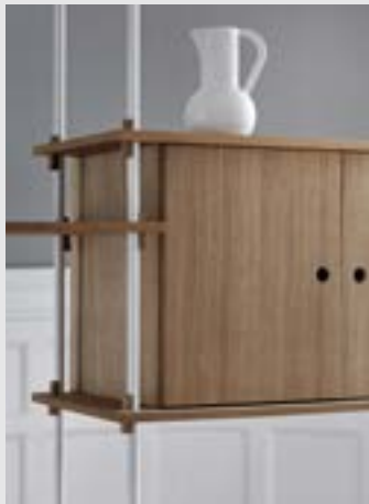
Shelving System | Page 15