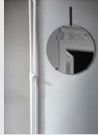
Wall Mirror | Page 7