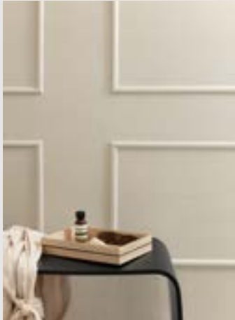
Organise | Page 10