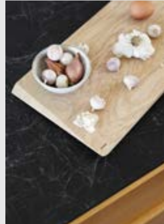
Cutting Board | Page 11