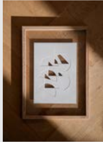
Papercut Artworks | Page 6