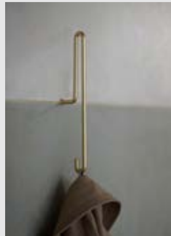
Wall Hook | Page 9