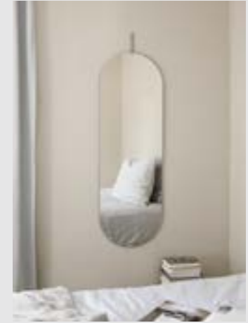
Tall Wall Mirror | Page 8