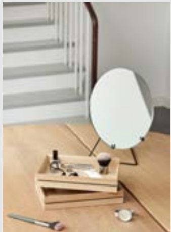
Standing Mirror | Page 8