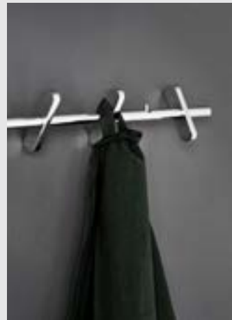
Coat Rack | Page 8