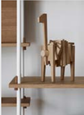
Polygrif | Page 10