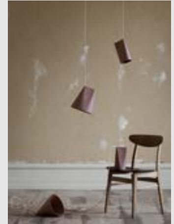
Ceramic Pendant | Page 11