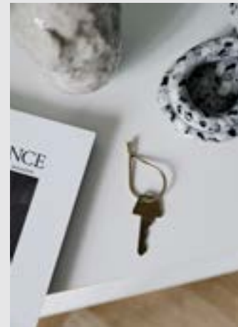
Key Ring | Page 9