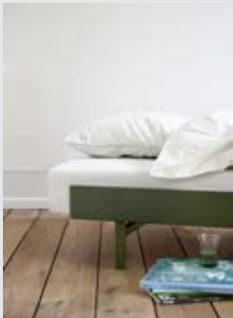
Bed | Page 13