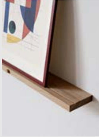
Gallery Shelf | Page 6