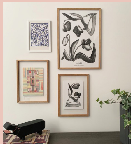
STILLEBEN PRINT COLLECTION