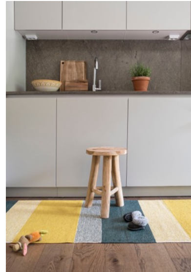
イン&アウトドア ラグ シーズンズ(サニー)

スウェーデンの母娘3人による、豊かな自然にデザインの着想を得たテキスタイルブランド「BRITA SWEDEN (ブリタ スウェーデン)」の2019年秋冬新商品が9月初旬より順次入荷いたします。