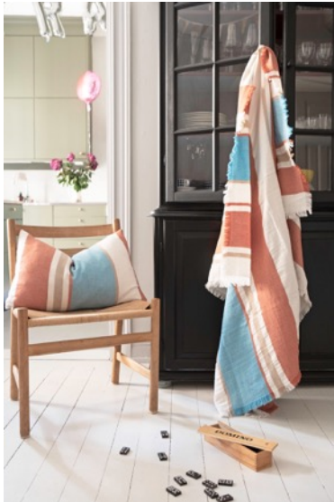
スロー メリノミックス セジム(アクアオレンジ)

北欧テキスタイル【BRITA SWEDEN】の2019秋冬新商品 メリノミックスとリサイクルコットンのスローが日本で本格スタート。 人気のプラスチックフォイル製ラグにも新デザイン登場。 〈9月初旬より順次入荷予定〉