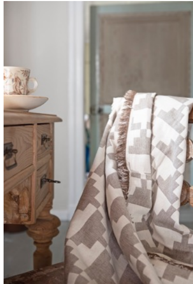
スロー リサイクルコットン コンフェクト(カカオ)