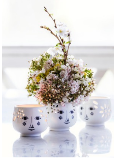
ティーライトホルダー