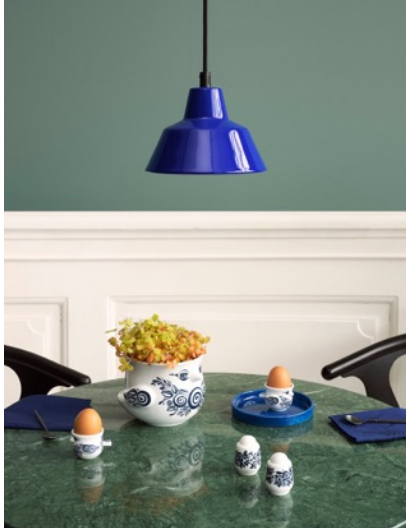
フラワーポット、エッグカップ、ソルト&ペッパー