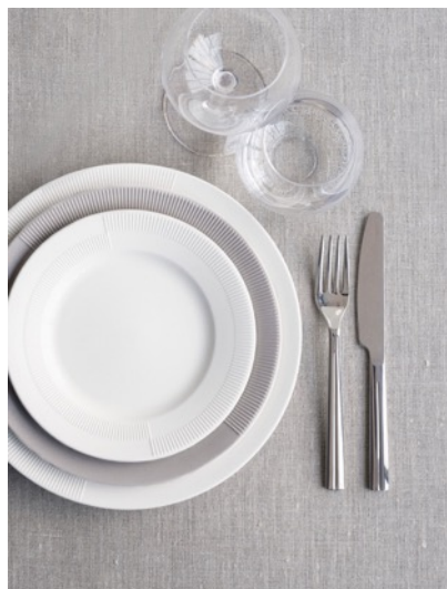
Duetシリーズ「プレート」