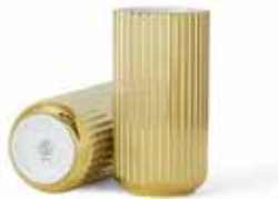
No. 200597 ゴールド H20cm ¥ 22,000 φ 10cm H20cm