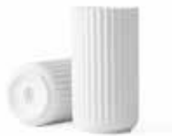
No. 200834 マットホワイト H15cm ¥ 9,500 φ 7.5cm H15cm