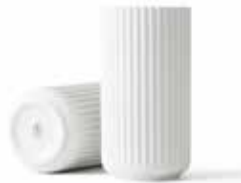
No. 200836 マットホワイト H20cm ¥ 14,000 φ 10cm H20cm