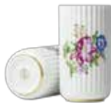
No. 200682 フラワー H15 cm ¥ 10,000 φ 7.5cm H15cm

素材：磁器 / 原産国：ドイツ ※サイズ [φ] は内径（口径）になっております。