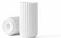
No. 200832 マットホワイト H12cm ¥ 7,500 φ 6cm H12cm