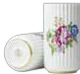
No. 200682 フラワー H15 cm ¥ 10,000 φ 7.5cm H15cm

素材：磁器 / 原産国：ドイツ ※サイズ [φ] は内径（口径）になっております。