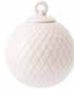
No. 201238 バブル ソフトピンク ¥ 3,000 φ 6.5cm