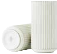
No. 200695 ゴールドライン H20cm ¥ 24,000 φ 10cm H20cm