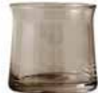
No. 201327 タンブラー S スモーク 廃盤 ¥ 3,000 200ml H7cm