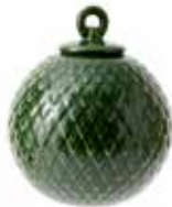
No. 201246 バブル グリーン ¥ 3,000 φ 6.5cm