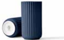
No. 200874 ブルー H15cm ¥ 10,000 φ 7.5cm H15cm