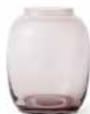
No. 201412 140/1 バーガンディー ¥ 5,500 φ 9cm H13cm