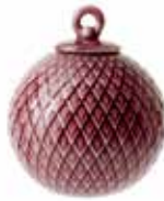
No. 201242 バブル ボルドー ¥ 3,000 φ 6.5cm