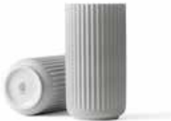
No. 200820 ライトグレー H20cm ¥ 13,500 φ 10cm H20cm