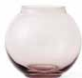
No. 201426 70/3 バーガンディー ¥ 7,500 φ 8cm H14cm