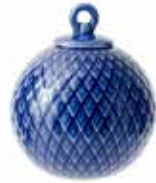
No. 201244 バブル ブルー ¥ 3,000 φ 6.5cm