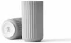
No. 200818 ライトグレー H15cm ¥ 10,000 φ 7.5cm H15cm