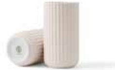
No. 200850 ソフトピンク H15cm ¥ 9,500 φ 7.5cm H15cm