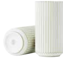
No. 200697 ゴールドライン H25cm ¥ 40,000 φ 14cm H25cm