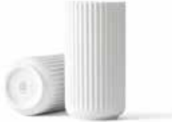
No. 200783 ホワイト H20cm ¥ 10,000 φ 10cm H20cm