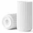
No. 200832 マットホワイト H12cm ¥ 7,500 φ 6cm H12cm