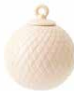
No. 201248 バブル ニード ¥ 3,000 φ 6.5cm