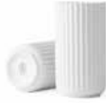
No. 200834 マットホワイト H15cm ¥ 9,500 φ 7.5cm H15cm