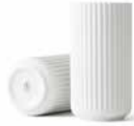
No. 200836 マットホワイト H20cm ¥ 14,000 φ 10cm H20cm