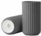
No. 200864 ダークグレー H15cm ¥ 10,000 φ 7.5cm H15cm