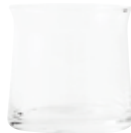
No. 201325 タンブラー S クリア 廃盤 ¥ 3,000 200ml H7cm