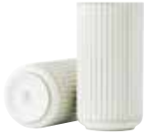
No. 200681 ゴールドライン H15cm ¥ 20,000 φ 7.5cm H15cm