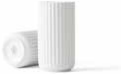
No. 200775 ホワイト H15cm ¥ 9,000 φ 7.5cm H15cm