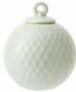
No. 201240 バブル ソフトグリーン ¥ 3,000 φ 6.5cm