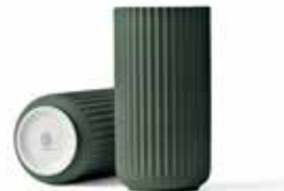
No. 201586 グリーン H20cm ¥ 13,000 φ 10cm H20cm