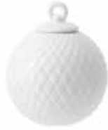
No. 201236 バブル ホワイト ¥ 3,000 φ 6.5cm