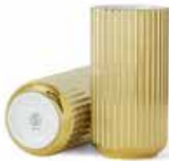
No. 200597 ゴールド H20cm ¥ 22,000 φ 10cm H20cm