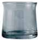
No. 201323 タンブラー S ブルー 廃盤 ¥ 3,000 200ml H7cm