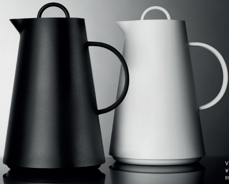
VACUUM JUG 1L ¥6,000 + Tax Black [BJ001] White [WJ001]